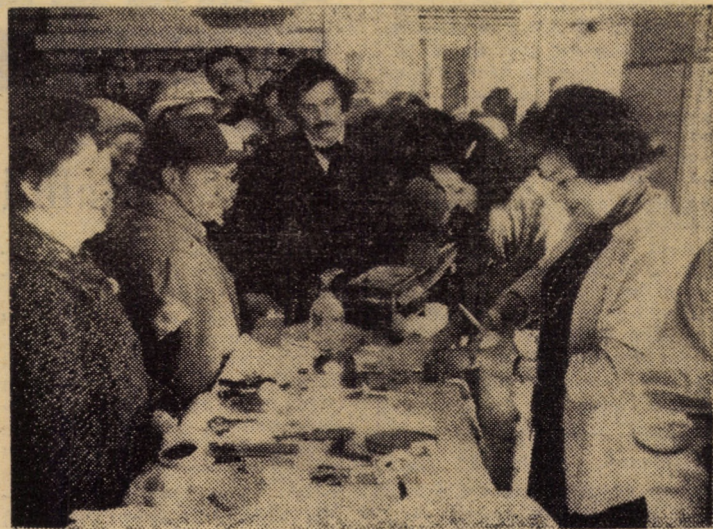
Zilele trecute, la magazinul nr. 101 „Ferometal“ din Sibiu au fost organizate demonstrații practice cu diferite articole de uz casnic și aparataj electric, explicîndu-se cum trebuie folosite acestea în gospodărie.

De menționat că în angajamentul anual al colectivului, de a da o producție suplimentară de 1 milion lei, figurează, printre altele, darea în folosință a Stației de uscare a gazelor Fintinele (Bistrița) cu un avans de 30 zile, echiparea a 10 instalații tehnologice cu 15 zile înainte de termen și modernizarea șoselei A. Iancu cu un avans de 30 zile.