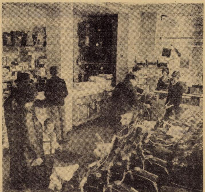
Recent, în urma lucrărilor de renovare, magazinul 147 „Victoria” din orașul Cisnădie și-a extins spațiul de prezentare a mărfurilor

Evident, în toate aceste direcții criteriul primordial la care trebuie să se raporteze acțiunile și inițiativele oamenilor muncii este eficiența. Lucru într-un tot posibil, spiritul de bun gospodăru reprezentând una din calitățile de căpătii ale unui proprietar și producător, calea, unica posibilă, a creșterii bunăstării fiecăruia.