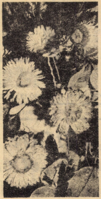
Sint acestea scînteuțe? Pure, măștișoarele Luminează sufletele Orbitor, ca soarele.