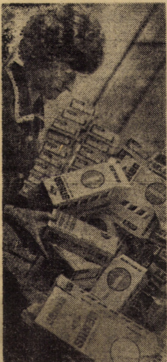
I.P.L. Sibiu. F.in schimbarea ambalajelor pentru creioane din cutii mai mici în altele cu dimensiuni mai mari, în secția cartonaje a sectorului I se realizează anual o economie de carton de 7 000 kg