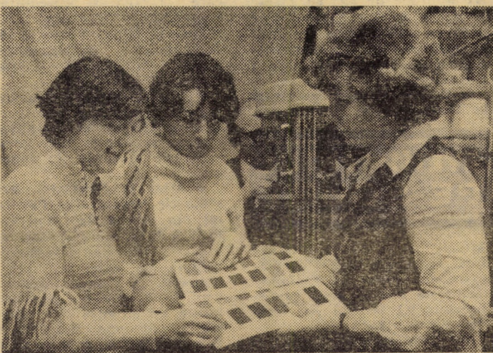
La ultimele contractări pentru anul 1978, semestrul I, colectivul sectorului creație al întreprinderii „7 Noiembrie” Sibiu a prezentat un număr de 34 modele noi de ciorapi din care au fost acceptate 26. În prezent se lucrează intens la pregătirea colecțiilor pentru semestrul II al acestui an.

dinea de zi. În intenția de a utiliza o mai mare cantitate de sticlă în fluxul producției s-au creat noi modele pe formele deja existente. Numărul produselor de serie lungă aflate în fabricație, împreună cu noile modele omologate sau în curs de omologare în acest an, vor ajunge la peste 180. Printre noutățile în această direcție: serviciile de tort,