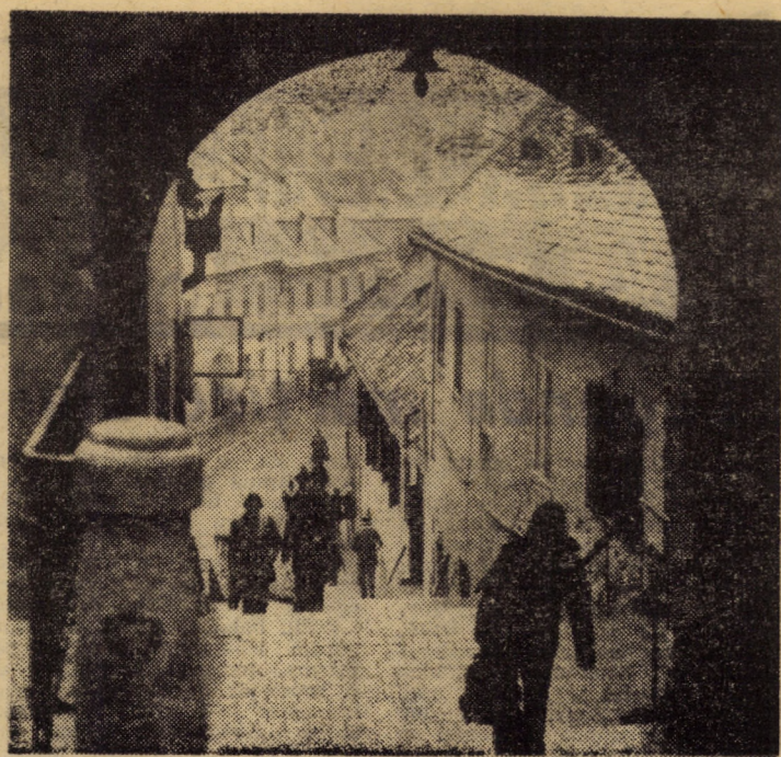
„Turnul scării” — cale de acces spre „orașul de jos” al Sibiului

(Continuare în pag. a III-a) N. I. DOBRA