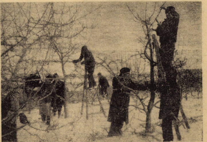
Tăierile la pomi — lucrare la zi și de mare importanță. În foto: secvență de muncă la Ferma V — Teișel

Nu putem încheia fără a aminti că dezbaterile din cadrul adunărilor generale ale cooperativelor au reliefat faptul că în unele livezi (vezi C.A.P. Racovița) una din cauzele care au dus la compromiterea producțiilor este lipsa de preocupare pentru executarea lucrărilor recomandate de tehnologii. În unitatea amintită lucrurile au ajuns pînă acolo încît din pricina tufărișului nu se mai poate trece de la un pom la altul. Folosim acest exemplu pentru a aminti tuturor deținătorilor de pomi că „fructe ca la I.A.S.” se pot obține numai prin muncă neobosită, de dimineața pînă seara, pe tot timpul anului, făcută cu pricepere.