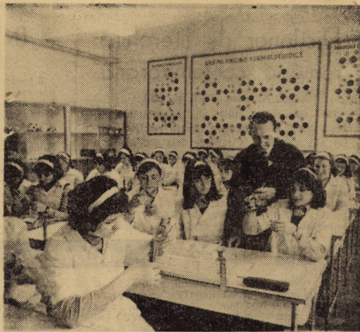
Laboratorul de chimie și mase plastice al Grupului școlar M.I.U. din Sibiu, realizat cu forțe proprii, dispune de 36 locuri, instalații de apă, gaze, canal, precum și de un bogat material didactic ilustrativ, asigurând elevilor condiții optime de învățură.