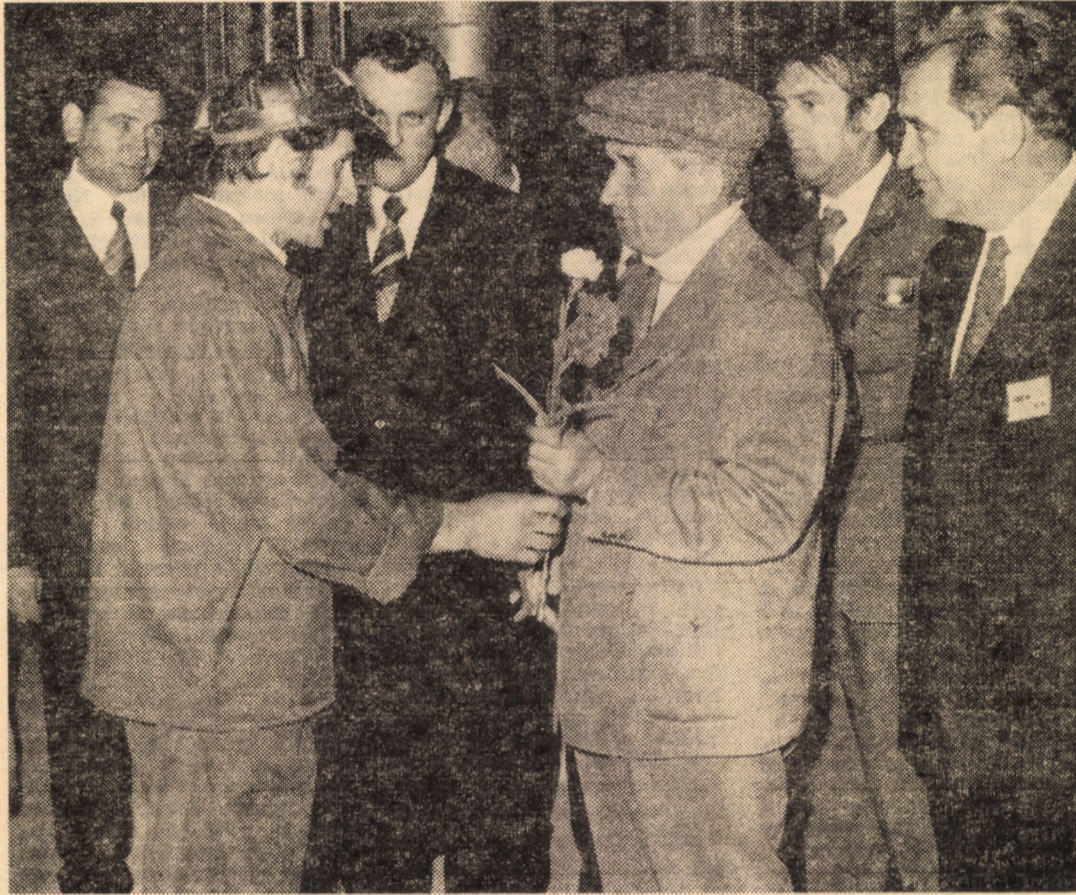
Septembrie 1974. În mijlocul puternicului colectiv muncitoresc de la „Independența”

Memorabila festivitate consacrată omagierii secretarului general al Partidului Comunist Român se încheie prin intonarea, de către întreaga asistență, a imnului de luptă al clasei muncitoare, „Internationale”.