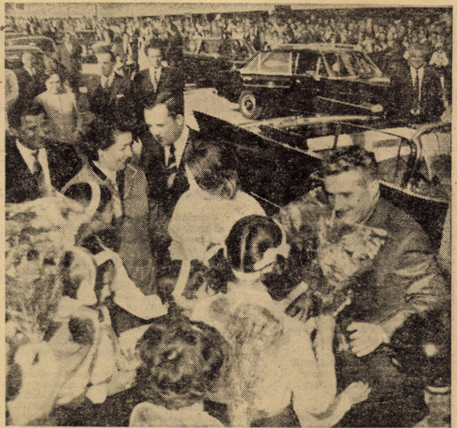
Cisnădie, septembrie 1974. Un eveniment de neuitat în istoria orașului textileștilor, mindru de tradițiile sale, dar mai ales de minunatele perspective de dezvoltare deschise de înțeleapta politică a partidului, de indicațiile oaspetelui drag, tovarășul Nicolae Ceaușescu. Urmind îndemnul primului bărbat al țării care, aici la Cisnădie, a oferit muncitorilor și specialiștilor prezenți o adevărată lecție de inginerie științifică și economică, orașul de sub poalele Măguri traversează o etapă de fecunde izbinzi