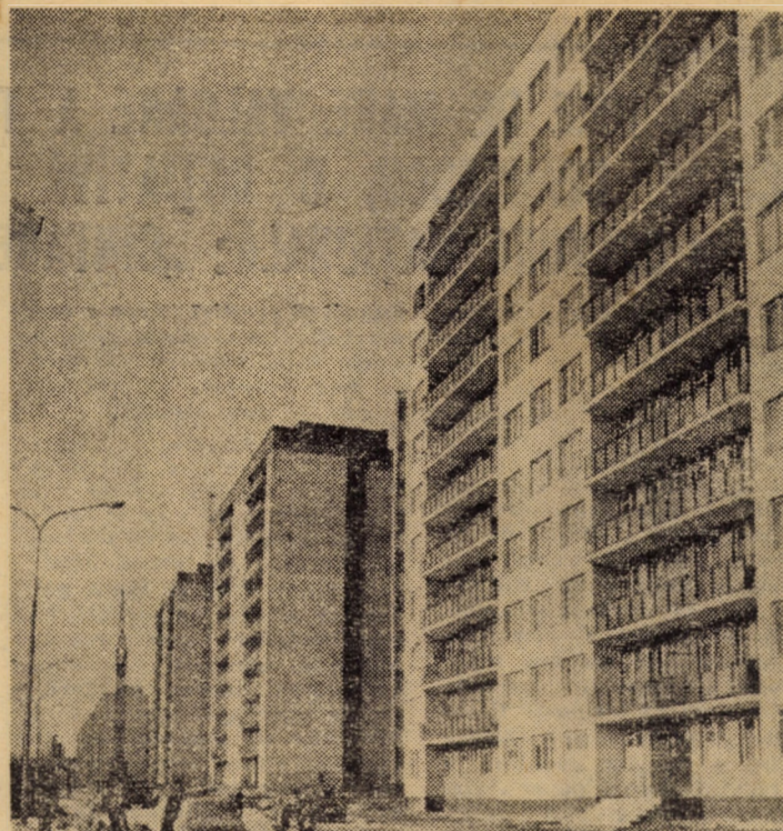
Dintre noile blocuri cu zece etaje ridicate recent în cartierul sibian Hipodrom III: blocurile P6, P7 și P8, ultimul de curînd dat în folosință