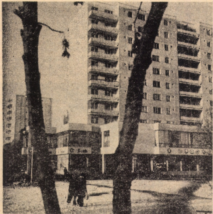
Din peisajul urbanistic al cartierului mediașean „După zid”