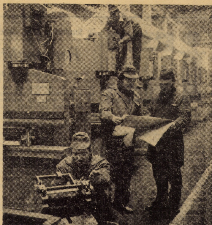
În secția montaj a întreprinderii „Mecanica” Sibiu, în anul 1977, a fost executată peste prevederile planului o producție marfă valorînd peste 20 milioane lei. În foto: linia de prese pentru îndoit tablă