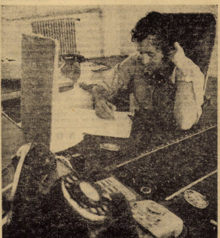
În camera de comandă a dispecerului energetic al întreprinderii de rețele electrice Sibiu

sumului de energie electrică și combustibil. 6. Depășirea cu 20 milioane lei a sarcinilor planului prestărilor de servicii către populație. 7. Dezvoltarea și îmbunătățirea transportului în comun prin autototarea cu 50 tramvaie de mare capacitate triplu articulate și modernizarea a 60 de tramvaie; extinderea rețelei de tramvaie cu 4,2 km cale dublă și cele de troleibuze cu 2 km cale dublă; modernizarea căilor de rulare pentru tramvaie și a drumurilor pentru troleibuze și autobuze. ★ Ne exprimăm convingerea că întrecerea ce se va desfășura între organizațiile județene de partid va constitui un factor important pentru realizarea unor ritmuri tot mai înalte în dezvoltarea economiei, a vieții sociale, pentru accentuarea laturilor calitative ale întregii activități desfășurate, contribuind într-o măsură sporită la continuarea înflorire a patriei, la ridicarea permanentă a nivelului de trai, material și spiritual al poporului. Comitetul municipal București al Partidului Comunist Român