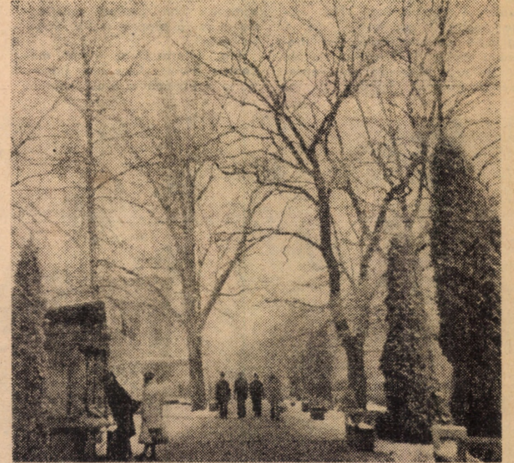
Sibiul în haina iernii

■ Mîine de la ora 10, membrii comandamentelor cercurilor pionierești vor fi prezenți la Casa pionierilor și șoimilor patriei din Sibiu pentru a participa la o instructivă convorbire pe teme de politică internațională cu genericul: „Pe meridianele lumii”.