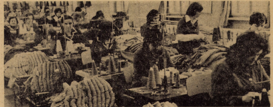
Întreprinderea „Drapelul roșu” — sectorul II Sibiu. Printr-o mai bună organizare a fluxului tehnologic și a aprovizionării locurilor de muncă din secția confecții lină, colectivul de aici reușește depășirea planului lunar de producție, asigurîndu-se totodată tricotate de bună calitate

— De acord... Întreprinderii noastre îi revine să exploateze anual circa o jumătate de milion m.c. În acest volum de masă lemnoasă se includ și doboriturile de vînt (produse accidentale, cum le spunem noi). În fiecare din ultimii ani de plan am exploatat cca 100 mii m.c. material pro-