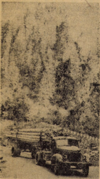
O nouă încărcătură de bușteni în drum spre platformele de preindustrializare

semnate sporuri de produse, printre care: capace delco, butoni aragaz și pickere (secția I.P.S.), ace pentru mașini de cusut și tindechi pentru industria textilă (Metal II), pioane, spete pentru războaie de țesut și alte accesorii textile (Metal I), precum și flori din masă plastică (Stilouri). Renumele binecunoscut al valorosului colectiv de la „Flaro” ne oferă garanția unor noi și însemnate succese, multiplicată la scara întregului an.