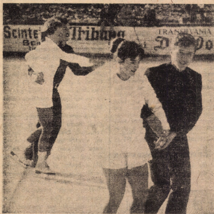
Demonstrație de patinaj artistic pe patinoarul tineretului din Sibiu

șef comisie cultural-artistică, Consiliul județean Sibiu al Organizației pionierilor