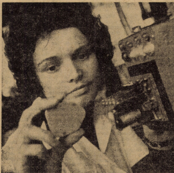
Controlul final la banda de montaj al releelor produse de Fabrica de aparataj electric Mediaș