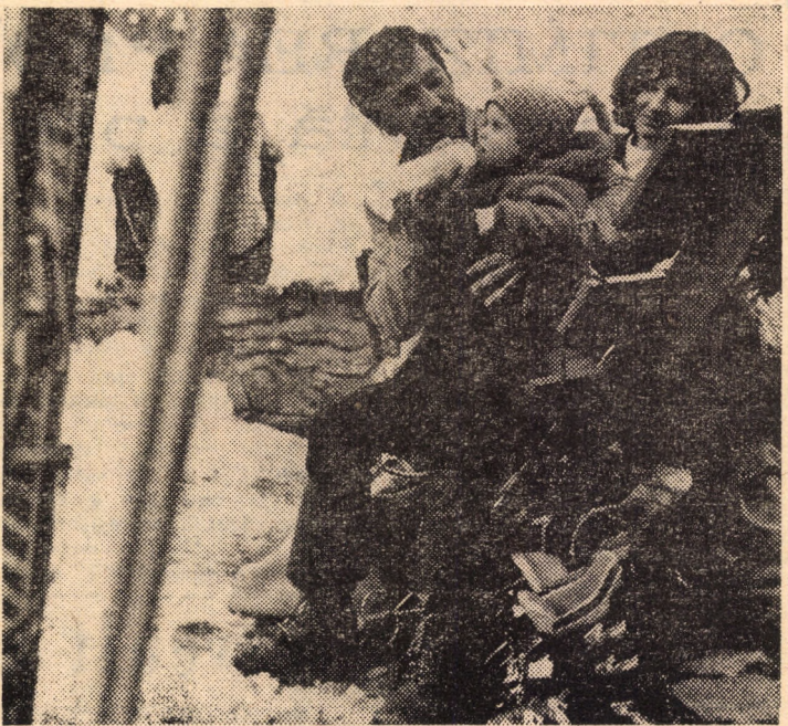
La înălțime de la mic la mare...