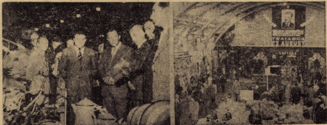
Aspecte de la deschiderea expoziției județene a bunurilor de consum

ASTĂZI ÎN JURUL OREI 8,00, POSTURILE NOASTRE DE RADIO ȘI TELEVIȚIUNE VOR TRANSMITE DIRECT DEMONSTRAȚIA OAMENILOR MUNCII CU PRILEJUL CELEI DE-A XXXIII-A ANIVERSĂRI A ELIBĂRĂRII ROMÂNIEI DE SUB DOMINAȚIA FASCISTĂ.