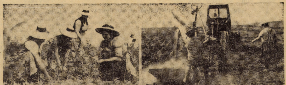
Imagini surprinzind secvențe din activitatea celor 10 echipe de altoitori ce lucrează la ferma pomicolă nr. 2 de la Șura Mică, a Stațiunii de cercetare și producție pomicolă, Sibiu

Evident că șirul acestor exemple de abordare critică a unor situații cu care se confruntă întreprinderea ar putea continua. Esențial ni se pare, că oamenii muncii privesc cu multă exigență și responsabilitate problemele de producție, căutînd de fiecare dată soluțiile optime de rezolvare, contribuind astfel la exercitarea pleneră a calității de producător și proprietar.