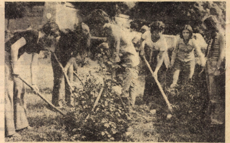
La întreținerea parcurilor sibieni își aduc contribuția și elevii Liceului nr. 1 din localitate

Metalul Plopeni; Rapid București — Prahova Ploiești; ETAPA a IX-a (23 octombrie): Prahova Ploiești — Unirea Alexandria; Progresul Buc. — Autobuzul Buc.; Chimia Rm. Vilcea — Carpați Sinaia; Pandurii Tg. Jiu — Șoimii Sibiu; Dinamo Slatina — Gaz metan Mediaș; Chim. Tr. Măg. — Electroputere Cv.; Metalul Plopeni — Celuloza Călărași; Metalul Buc. — Rapid București; F.C.M. Giurgiu — Muscelul C-lung; ETAPA a X-a (30 octombrie): Metalul Buc. — Pandurii Tg. Jiu; Gaz metan Mediaș — Rapid București; Electroputere Cv. — Muscelul C-lung; Celuloza Călărași — Chimia Rm. Vilcea; Șoimii Sibiu — F.C.M. Giurgiu; Dinamo Slatina — Metalul Plopeni; Carpați Sinaia — Chimia Tr. Măg.; Prahova Ploiești — Autobuzul Buc.; Progresul Buc. — Unirea Alexandria; ETAPA a XI-a (6 noiembrie): Chimia Rm. Vilcea — Progresul Buc.; Unirea Alexandria — F.C.M. Giurgiu; Autobuzul Buc. — Dinamo Slatina; Muscelul C-lung — Metalul București; Celuloza Călărași — Gaz metan Mediaș; Pandurii Tg. Jiu — Carpați Sinaia; Metalul Plopeni — Electroputere Cv.; Rapid București — Șoimii Sibiu; Chim. Tr. Măg. — Prahova Ploiești; ETAPA a XII-a