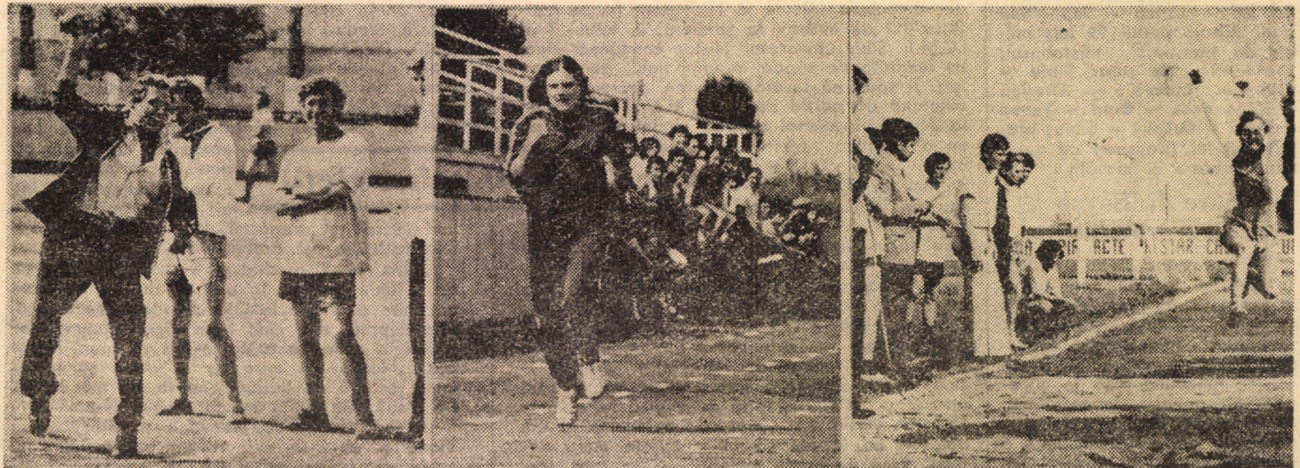
Duminică pe terenul Voinea din Sibiu a avut loc un concurs interjudețean în care s-au întîlnit cooperatorii de la „Timpuri noi” Sibiu, și cei de la „Munca invalizilor” lași la atletism, șah, popice, tenis de masă și fotbal. Au cîștigat sibienii care s-au calificat pentru finale ce se vor desfășura la Galați în zilele de 6-7 septembrie a.c., Foto: V. CIRDEI

Pro 9,00 10,00 mult și t Brar 11,00 l apa 24 c port 11,20 l 11,40 t 11,45 l gran 16,00 t 16,05 l tru agric 16,35 l de c 16,55 N lară 17,05 S ziun 19,20 l 19,30 T 20,00 l 20,10 S tru; de C Prem 21,20 C niei laure valul 21,40 M treba 22,20 T Ci SIBIU ca vec 11,30; 1 Arta: pumn e le 10; și 20,30 „Mica 10; 14; Independ nierul orele 1 20,30. MEDI sul: „U Texas”, 13,45; 1 Tineretu tră în 10; 16,3 L. L. „Aeropc 10; 14; CISNA/ „Circul serii, o și 20. AGNI „Sora A 16; 18 s DUME Noiemb șerifulu see”, or OCNA „Expres de zăpe și 20. BAZN bul s orele 17 APOL 23 Augu neuitat”, 20,30. AVRI Lazăr”: un dezn cit”, ore TALM roșu: „P și 19. Timp (meteo B Miine, fi căldu șor inst les în amiezii, va fi ter și se averse ploaie descărcă Vîntul v pînă la dominînd vest și raturile fi cuprin și 15 gr maxime 28 grade.