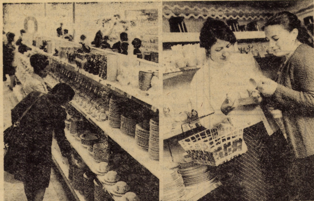
Vizitînd raionul de sticlărie și menaj al magazinului „Ferometal” din Sibiu, complet reamenajat, se poate remarca abundența de mărfuri prezentate într-un mod plăcut și atrăgător.