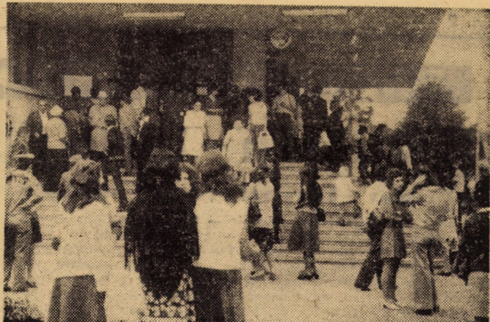
Ieri, 18 iulie, au început examenele de admitere în învățământul superior. O întrebare pe buzele tuturor: „Ce-o să ne dea oare la scris?”