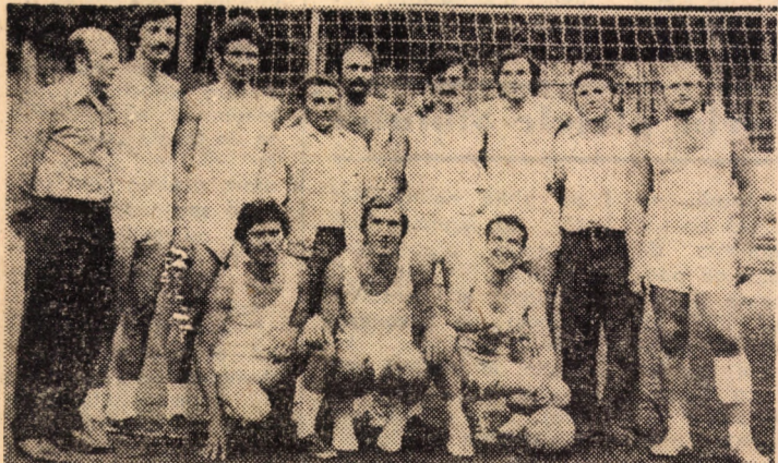
„Voleibaliștii de la „7 Noiembrie” Sibiu după finala care i-a promovat în divizia secundă