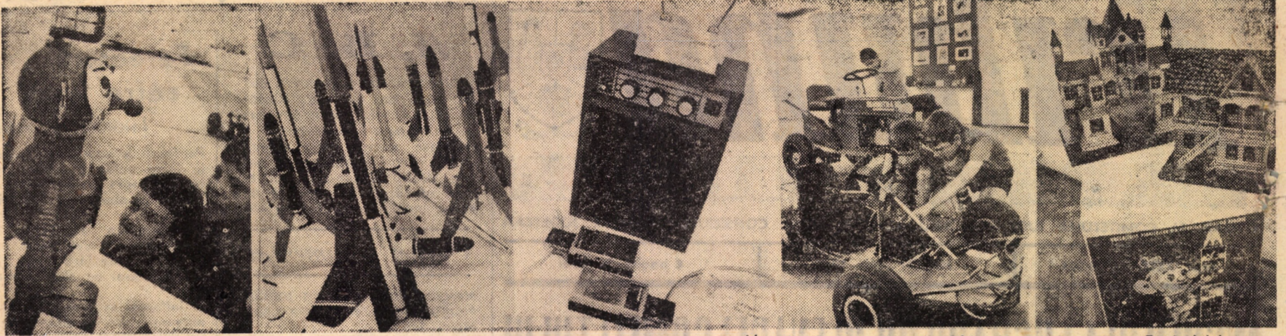
In fotomontajul de mai sus vă prezentăm câteva imagini de la Expoziția „Mintehnicus”, deschisă la Casa artelor din Sibiu, faza județeană a Festivalului național „Cântarea României”