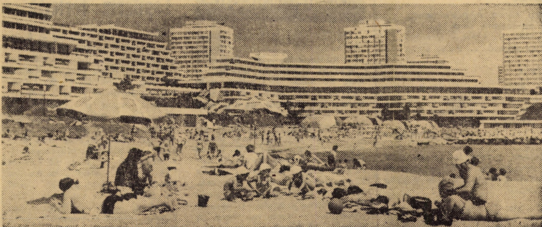
Sezonul estival la mare a început. Stațiunile litoralului își așteaptă primitoare oaspeții. Fotografia de față este o invitație, dar și un argument pentru cei ce doresc să-și petreacă concediul într-un mod cit mai plăcut