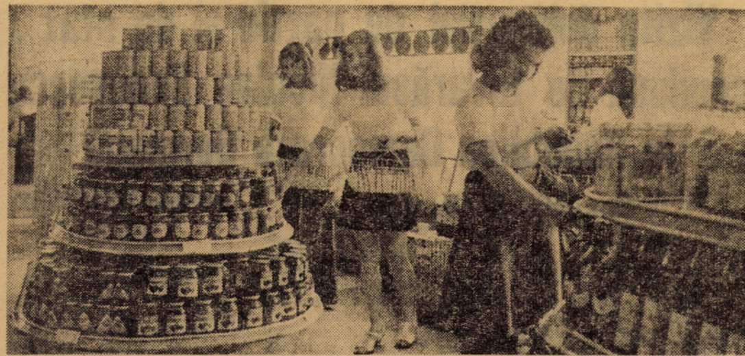
Gospodinele au ce alege din magazinele cîsnădiene!

5. Să dăm Cezarului ce-i al Cezarului! Să vorbim adică