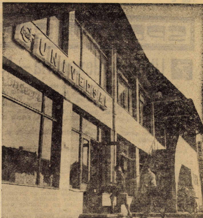
Imagine din centrul Avrigului: magazinul universal

Concursul de admitere în învățămîntul superior (zi, seara, fără frecvență) pentru anul I 1977—1978 va începe la 18 iulie a.c., în loc de 12 iulie, așa cum a fost comunicat anterior; la specializările la care concursul se desfășoară în două etape, etapa I începe la 12 iulie, iar etapa a II-a la 18 iulie. Înscrierea candidaților la concurs va avea loc între 10 iulie și 15 iulie. La specializările la care concursul începe în ziua de 12 iulie, intervalul de înscriere este 30 iunie—4 iulie inclusiv.