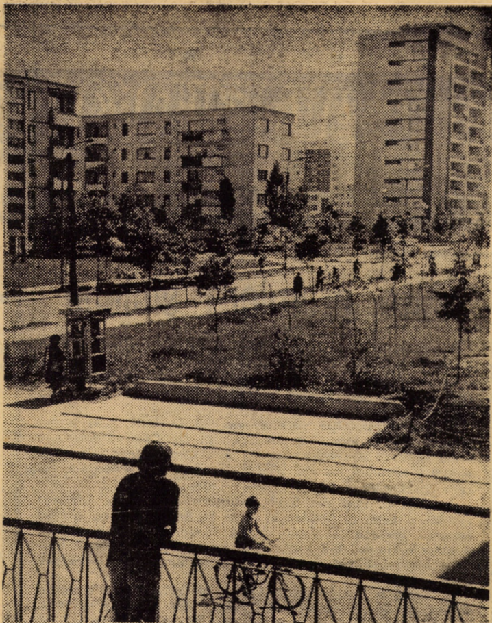
Ilustrată din cartierul Hipodrom I.