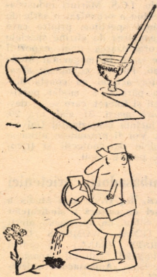
Fără cuvinte Desene de Rudy Schmückle