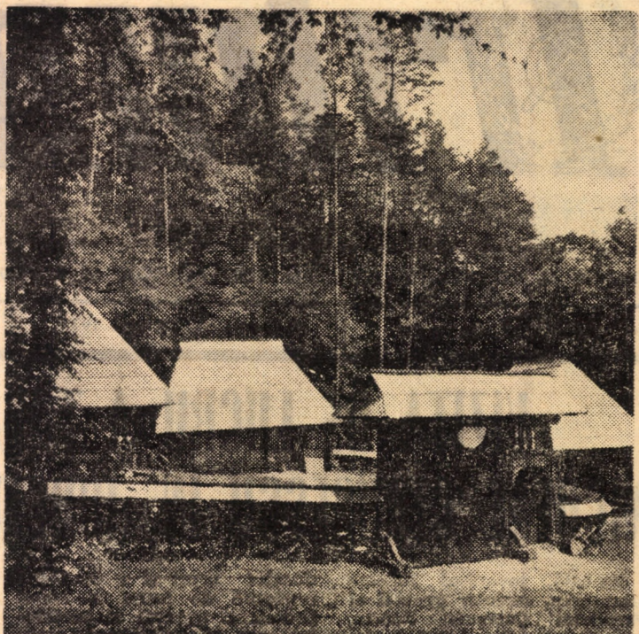
Muzeul tehnicii populare Sibiu: gospodărie și atelier de fierar — Călinești Maramureș