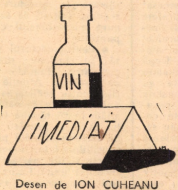
Desen de ION CUHEANU

Dezlegarea careului nr. 11: AUGUST, ARC DE TRIUMF BRAD — BANUTA — INSURECȚIE — R — AMENT — URA — NIMICI — IMEN — AN — TAUȚU — ND — TIR — CALF — R — BOTEZ — C — ROI — ARES — AUGUST — NS — CINTĂM — O — U — MUNCITORI — SUA — SA — ASAU.