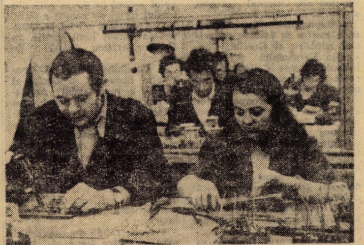
Locurile de muncă din atelierul electric II al ICEMENERG, subunitatea Sibiu — montaj instalații de automatizare — sint ocupate în bună parte de cadre tinere, bine pregătite profesional.