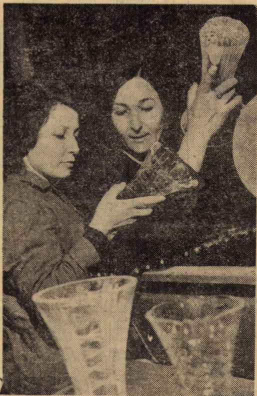
„Vitrometan” Mediaș: în secția cristal, adică acolo unde se nasc din mîini pricepute, adevărate bijuterii, inegalabile comori de lumină și frumusețe. Toate acestea, într-un nume: cristalul românesc