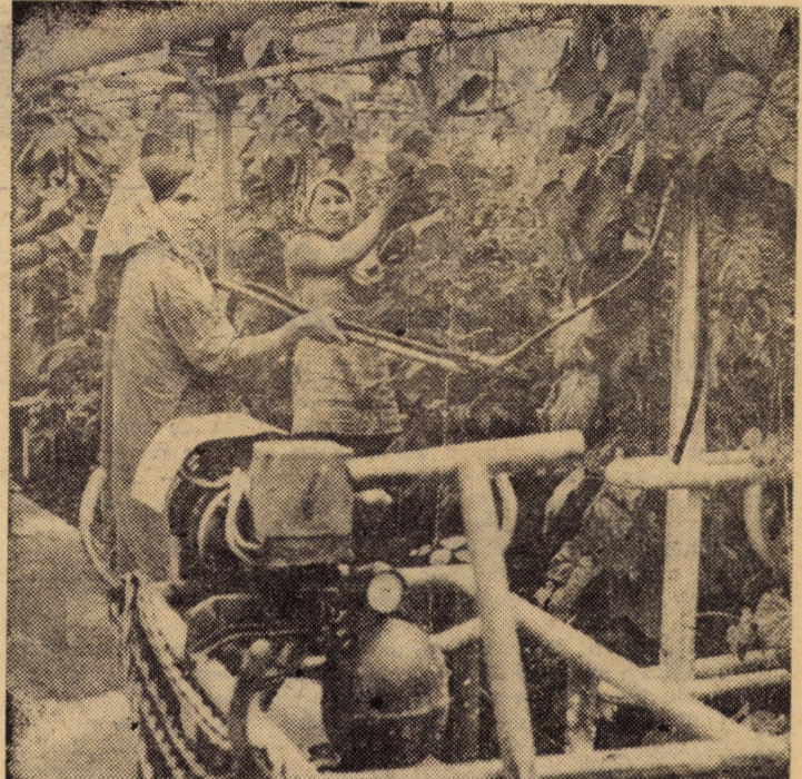
Stropitul castraveților în seră

lorifice aceste calități. Realmente, este o plăcere să colaborezi cu asemenea cadre. Cum să mi-i doresc, deci, decît așa cum sînt! Cu o mențiune, totuși: numeroaselor idei și propunerii cu care îmbogățesc planurile noastre de activitate, trebuie să le asocieze intervenții ferme pentru aplicarea hotărîrilor în toate sectoarele întreprinderii. Așadar, e absolut necesar să nu-și considere rolul încheiat o dată cu înregistrarea propunerii sau sublinierea unei probleme! Evident, știu că, la rîndul nostru, trebuie să le asigurăm toate condițiile pentru exercitarea atribuțiilor și răspunderilor. Aceasta presupune înformarea lor cu problemele întreprinderii, crearea unei ambianțe de lucru stimulativă, perfecționarea permanentă a pregătirii generale și specifice. Sînt convins că numai cu asemenea oameni și în aceste condiții se poate exercita plener și eficient dubla calitate a oamenilor muncii, se pot valorifica superior inițiativele și înțelepciunea colectivă, se pot fundamenta temeinic deciziile economice, realizîndu-se în fapt natura democratică a societății socialiste și a sistemului nostru de organizare.