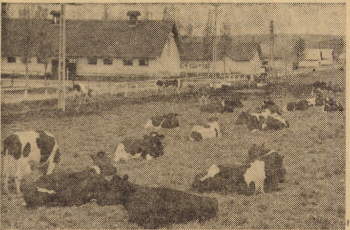
Vaci de înaltă productivitate la ferma zootehnică a I.A.S. Dealul Ocnei