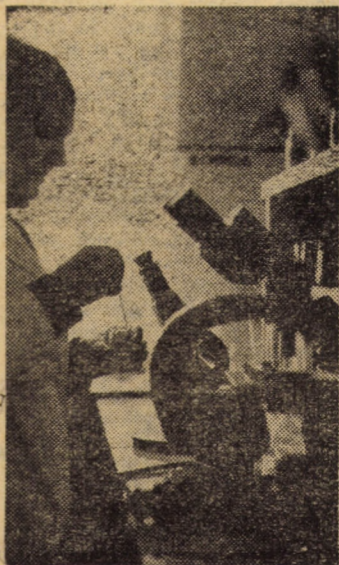
Controlul calității mîinii înainte de imbuteliere la laboratorul de analize al întreprinderii de omo- genizarea mîinii din municipiul Sibiu