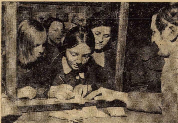
Pionierii Școlii generale din comuna Șeica Mică au depus suma de 1.100 lei în contul omeniei