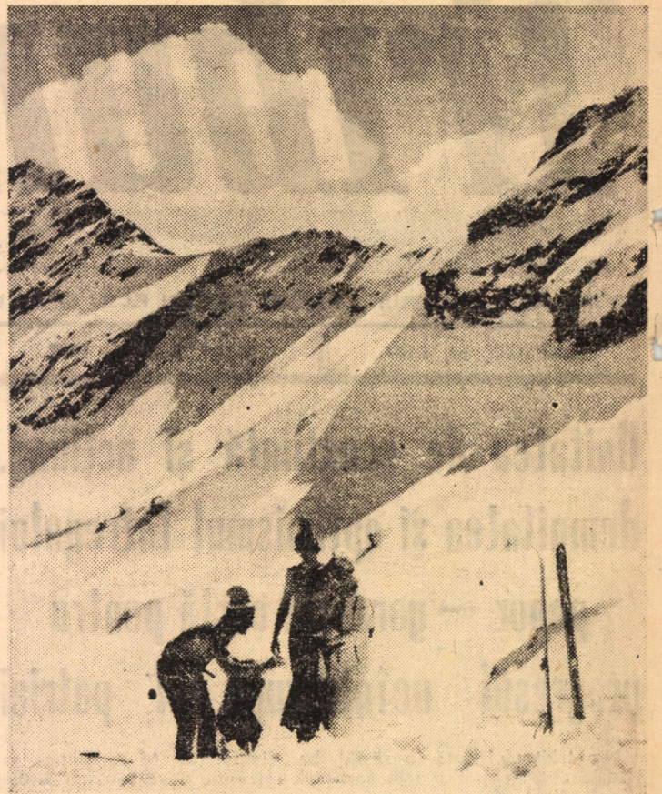
Căldarea Biliu — un adevărat paradis al schiorilor

16.00 — Telex. 16.05 — Telescoala. 16.35 — Curs de limbă rusă. 17.05 — Oceanul și viața. 17.35 — Repere braziliene. 18.00 — Interpretări virtuozice: David Ohanesian. 18.30 — România pitorească. 19.00 — Ziua Mon-