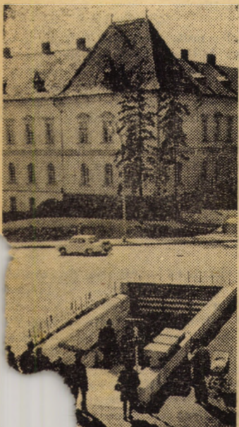
subteran pentru pie- scerie armonios în pei- sajul Pietii Unirii din Sibiu