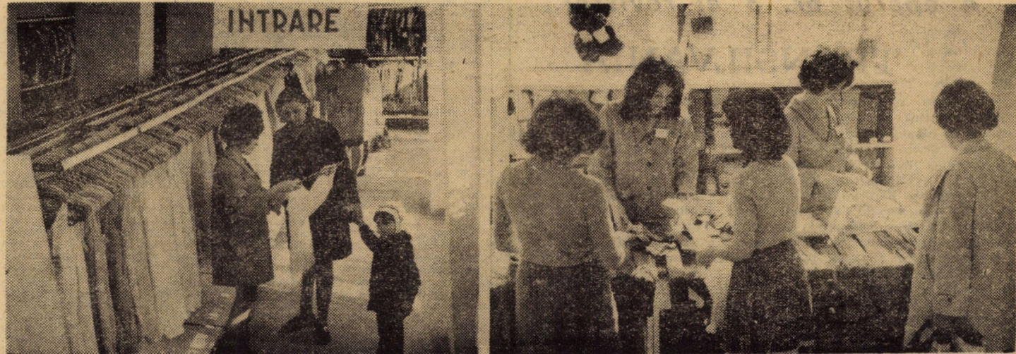
De citeva zile, la parterul blocului nr. 41 din cartierul Hipodrom III din Sibiu, printre alte noutăți comerciale, a fost dat în folosință magazinul nr. 91 specializat în produse de tricotaje, mercerie și lenjerie de damă; în imaginile de mai sus.

● „Cartea românească veche în biblioteca Brukenthal” ● „Ziua Mondială a Teatrului” ● Metamorfozele cunoașterii (III) ● Concursul nostru „File din epopea luptei pentru independența națională” ● Programul TV. ● Cinema ● ACȚIUNI, FAPTE, REALIZĂRI — adică muncă pentru grabnică reconstrucție ● Cronica unui timp eroic — 1877 (X).