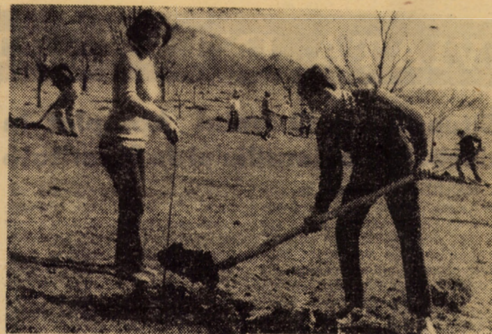
Educația prin muncă și pentru muncă îmbracă forme din secolul de concrete aici în plantația intensivă de la Cisnădioara, unde uteciștii cisnădieni de la Școala generală nr. 1 au plantat în săptămîna 21-26 martie a.c., citeva sute de puiți de cires