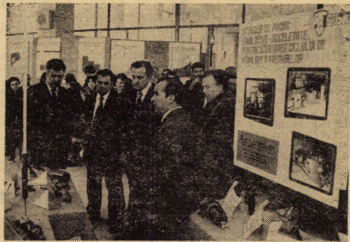
Eveniment remarcabil în peisajul economic sibian — deschiderea în sala de marmură a Casei de cultură a sindicatelor din municipiul reședință de județ, a expoziției „Creație, asimilare, calitate”. Afluența mare a vizitatorilor, precum și primele discuții cu produsele în față, conturează o reușită pe măsura preocupărilor făuritorilor de bunuri materiale de pe aceste meleaguri, circumscrise pregnant imperativelor cincinalului revoluției tehnico-științifice