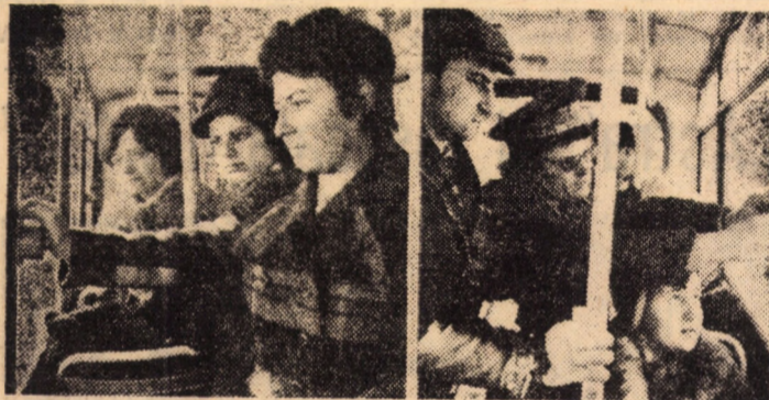
Primele zile de punere în aplicare a sistemului de autotaxare în municipiul Sibiu. Angajații ai E.T.S. ajută călătorii la folosirea corectă a acestui nou sistem