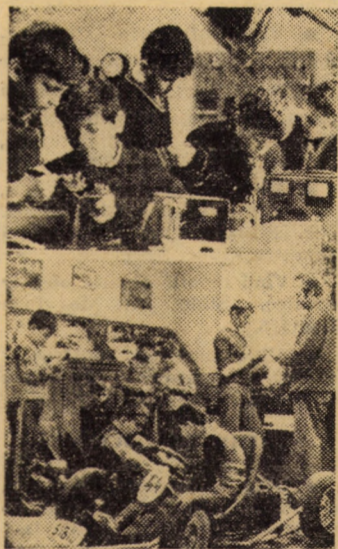
Aspecte din activitatea cercurilor de electronică și carturi

Oricît de mult s-ar fi îndepărtat reporterul de vîrsta pionieriei, o vizită în mijlocul elevilor care frecventează cercurile Casei pionierilor din Sibiu îi provoacă și-ți răscolește duioase amintiri. Amintirea atîtor lucruri frumoase și folositoare deprinse aici, pe care trecerea anilor nu mi le-a putut șterge din memorie și, nu mai puțin, amintirea unor gascăli inimoși, pasionați și răbdători, care ne-au îndrumat pașii dinții cu dragoste de părinte. Să ne întoarcem, însă, în prezent și să vedem care este viața „la