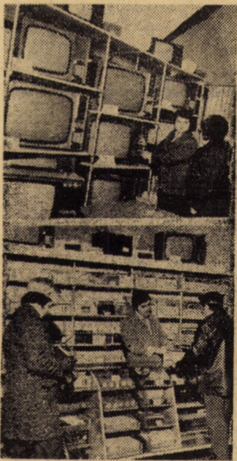
De cîteva zile, pe strada Avram Iancu nr. 7 din localitate (în fostul sediu al A.C.R.) s-a deschis un nou magazin specializat în vânzarea aparatelor de radio și televizoarelor de unde vă redăm cele două imagini