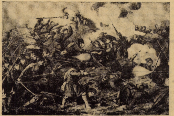
Asaltul românilor asupra redutei Grivița

Sava Henția, întors de la Paris se stabilește la București de unde pleacă în război în calitate de desenator pe lîngă Marele Cartier General, unde se alătură lui Grigorescu și Szathmary. Între lucrările mai reprezentative datorate perioadei amintite se înscriu „Trecerea Dunării pe la Corabia” și „Scene din timpul războiului”. CAROL COMȘA