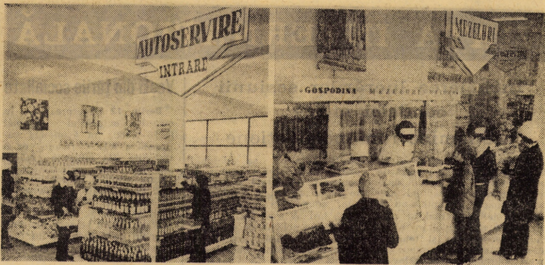
Noul magazin alimentar din cadrul complexului comercial ridicat recent în cartierul de locuințe „Gh. Gh. Dej” din municipiul Mediaș

cochetele fetișcane care nu te primesc totdeauna cu zimbetul pe buze, pentru că în ciuda aparențelor sînt și ele niște oameni ca mine și ca tine, cu zile mai senine și mai tulburi, cu gânduri și preocupări nu întotdeauna roze. Cu filmele care se încăpăținează să reziste „secolului vitezei”, păstrînd un ușor iz de patriarhalitate din epoca manufacturieră: „Ceaprazărie”, „Ceasuri și umbrele. Reparații (în curte)”, „Rame”, „Reparații stilouri” (mai toate însoțite de o săgeată sau o mină cu degetul întins spre întinerul unui gang prin care parcă pătrunzi într-o curte a miracolelor). Cu nelipsiții vinzători de loz în plic, cei dintii prezenți dimineața „la datorie”, cu cei trei vinzători de ziare pe care-i știu de cînd mă trimitea tata cu cițiva