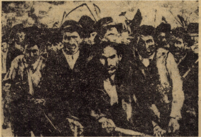
„1907” (Rudolf Schweizer — Cumpăna)

Puternicul răsunet pe care răscoala țărănimii din România anului 1907 l-a avut în rândurile transilvănenilor a fost determinat atât de asemănarea dintre dezvoltarea agrară a Transilvaniei și a vechii Români cât și de întărirea conștiinței naționale la românii transilvăni. În sinul maselor muncitoare din Transilvania, format în majoritate din țărani, scopurile urmărite de răscoală au găsit toată simpatia și aprobarea, fără deosebire de naționalitate. Ele au protestat energic împotriva reprimării singeroase și a teroarei dezlănțuite de burghezii și moșierime împotriva țăranilor participanți și a muncitorilor deopotrivă. De altfel, factorii care au generat marea răscoală a țăranilor din anul