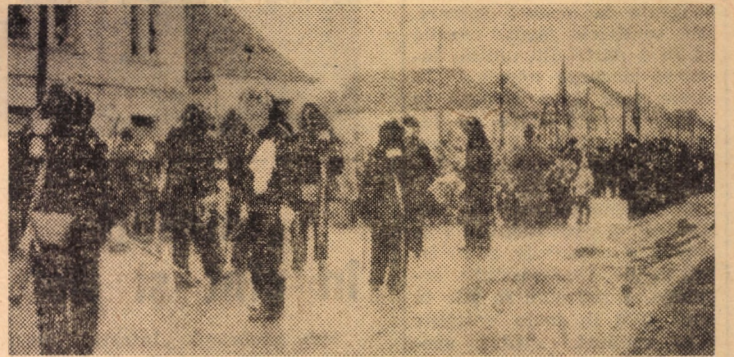
Aspect de la sărbătoarea lolelor