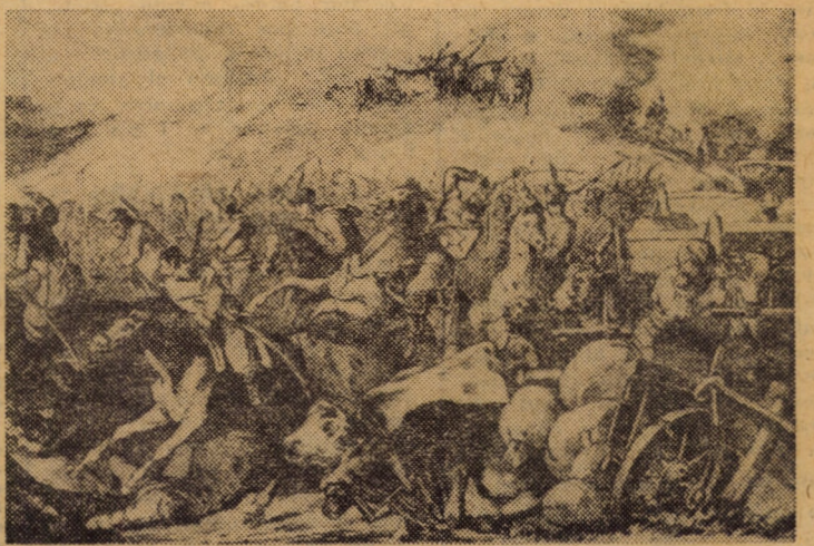
Prinderea unui transport de proviziuni a armatei turcești de către cavaleria română