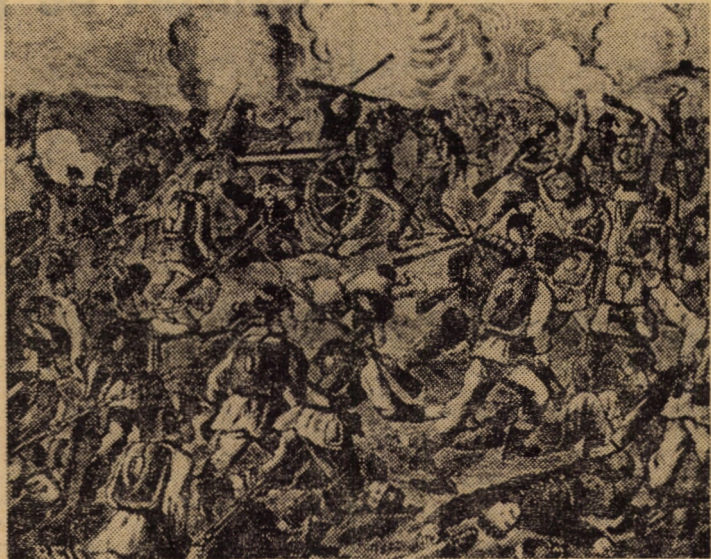
Asalt asupra redutei Grivița (Gravură)