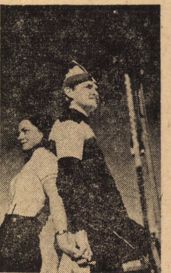
Cu gîndul la zilele însoțite...

10,30 - O viață pentru o idee. Dan Barbilian (1895-1961) eminent matematician. 11,00 - Film artistic (reluare). 12,30 - Mai aveți o întrebare? 13,10 - Cîntă orchestra „Flacăra Prahovei” din Ploiești. 13,40 - Publicitate. 13,45 - Documentar. 14,00 - Telex. 14,05 - Baschet feminin: I.E.F.S. București - Sesto San Giovanni în „Cupa Campionilor Europeni” (înregistrare). În pauză: „Sahul - sport, știință sau artă?” - un film cu campionul mondial Anatoli Karpev. 15,35 - Lieduri și aril din opere în interpretarea tenorului Ludovic Spiess. 16,15 - România pitorească. 16,45 - Virstele peiculei. 17,35 - Reportaj pe glob: Tamisa naste Londra. 18,00 - Cel mai bun contînuă. 18,50 - Ianuarie 1977 - Cronica evenimentelor politice interne și internaționale. 19,05 - Eroii îndrăgiți de copii: Heidi. 19,30 - Telex. 20,00 - Telex. 20,50 - Publicitate. 20,55 - Film serial: Kojak. 21,45 - Întîlnire cu satira și umorul. 22,45 - Telex. 22,55 - Campionatele Europene de patinaj artistic - proba individuală feminină.