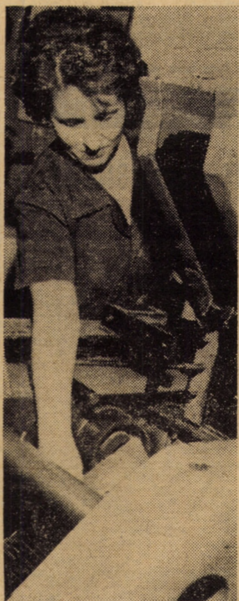
Secția finisaj a sectorului creioane a I.P.L. Sibiu. O ultimă operație: marcarea creioanelor

(Continuare în pag. a II-a) Lt. col. V. NEGHINA