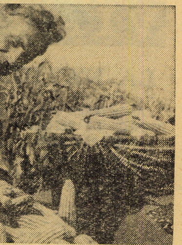
La C.A.P. ȘELIMBĂR, zilnic, 200 cooperatori ajutați de membrii de familie, de muncitori și personal T.E.S.A. din întreprinderi - lucrează la recoltatul porumbului.

(eu și nevastă-mea) în Fordul nostru interbelic, cînd, hait, pe strada Girlei, îmi sparge un „baie“.