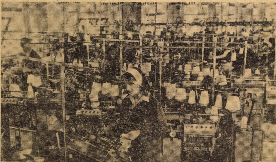
Utilaje de înaltă tehnicitate dar, deopotrivă, hărnicie și pricepere a celor care lucrează în acest modern atelier al Fabricii de mănăși și ciorapi Agnita

general al partidului la Constituirea de lucru de la Comitetul Central al P.C.R. din luna mai a.c. pentru a evidenția încă o dată posibilitățile și resursele materiale existente, pentru a sugera necesitatea folosirii lor cu simț de gospodărie în scopul realizării unei eficiențe economice cît mai ridicate. Cum s-ar putea traduce în limbajul faptelor acest lucru? În primul