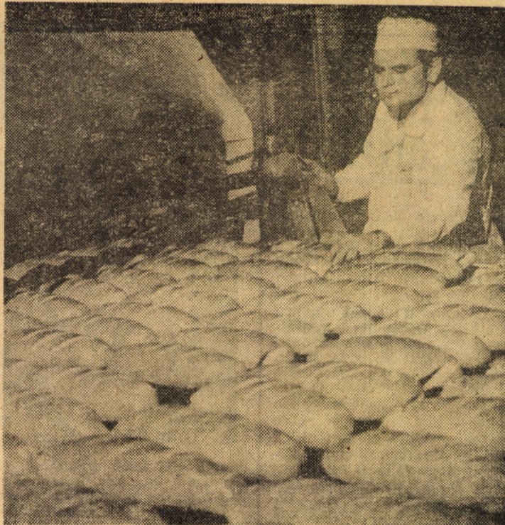
O nouă șarjă de piine produsă la Întreprinderea de morărit și panificație Sibiu