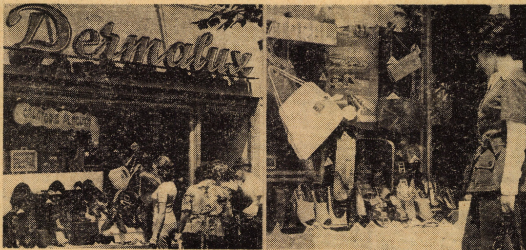
Magazinele „DERMALUX” de prezentare și desfacere a produselor întreprinderii „13 Decembrie” Sibiu