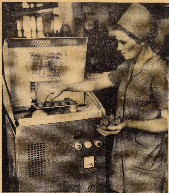
Cuptor de înaltă frecvență din compartimentul termorigide al secției I.P.S.H. de la „Flaro” Sibiu