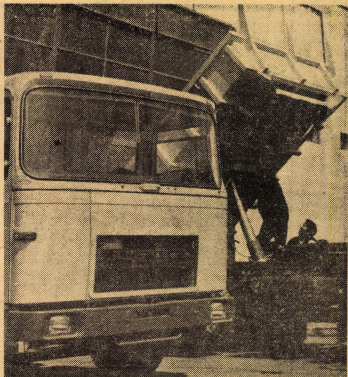
Întreprinderea mecanică Mirșa. Un ultim control al sistemelor hidraulice la autobasculante înaintea livrării la beneficiar