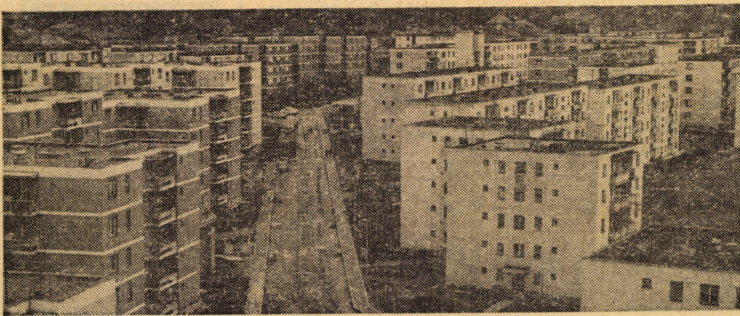
Din noile construcții de locuințe ale municipiului Mediaș