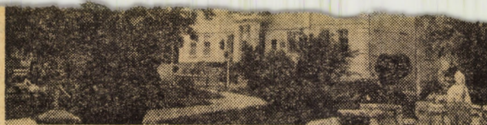
Ilustrată din centrul orașului Ocna Sibiului