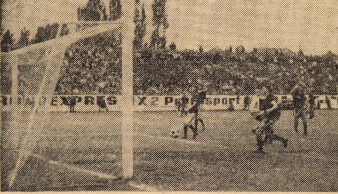
Una din numeroasele faze de poartă în meciul F.C. Șoimii - Mureșul Deva

jocuri acasă cu Victoria Carei și C.F.R. Timișoara. Teoretic și sibienii le pot obține învingînd (și trimițînd în divizia C) pe Minerul Moldova Nouă, pe Gloria Bistrița — în deplasare — și pe Corvinul, aici, la Sibiu, în penultima etapă. Practic problema golaverajului... Și totuși, în ciuda evidențelor, trebuie să luptăm pînă la capăt pentru că avem — ne-am făcut! — un nume pe care sîntem dator să-l apărăm. (Dacă ar fi să amințesc doar faptul că în cele 14 etape ale returului am pierdut un singur joc și am primit numai trei goluri...). Gaz metan a obținut un punct "de aur" la Timișoara în fața acestei capricioase echipe care este C.F.R., dar n-a scăpat de emoții pentru că mai are două deplasări (la Cugir și Călan) și cu 31 puncte, în sezonul actual, se retrogradează. Pentru locurile 15-16 "candidează" Dacia Orăștie, Minerul Moldova Nouă, Industria Sirmei, Gaz metan și chiar Rapid Arad. În concluzie, acum cînd mai avem numai trei săptămîni de fotbal, lucrurile sînt mai puțin limpezi decît par a fi. D. IONAȘCU