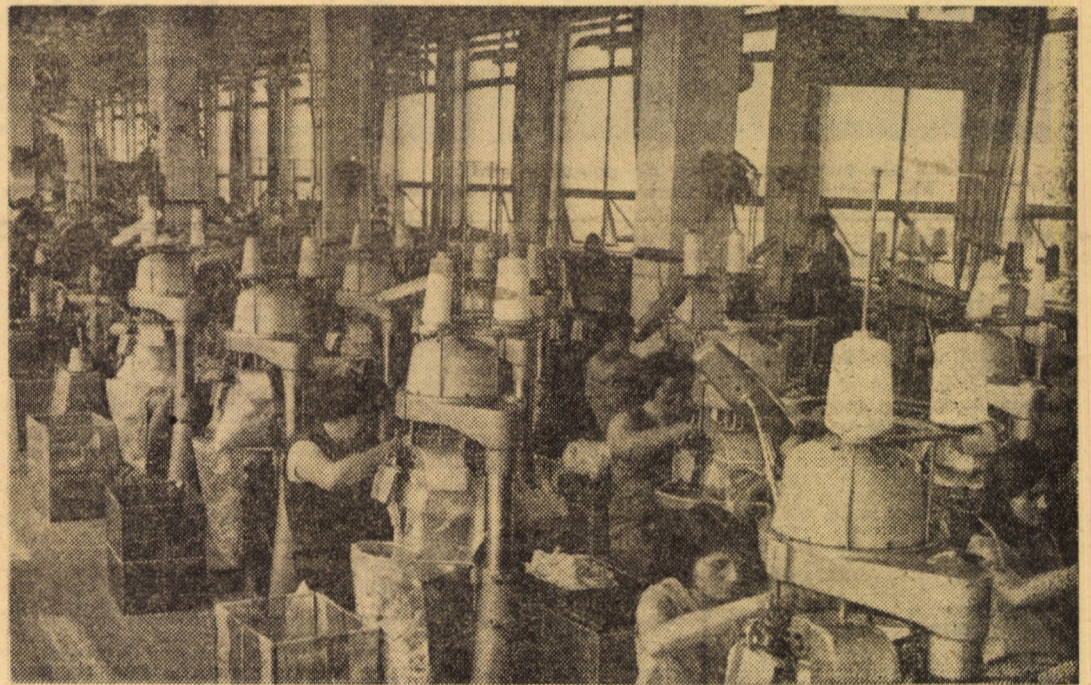
Imagine din secția încheiat a Întreprinderii „7 Noiembrie Sibiu, sectorul II