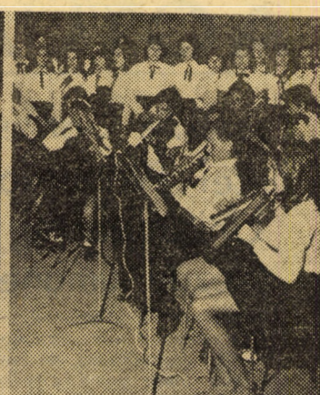
Aspecte de la festivitatea aniversării a 100 de ani ai Școlii generale nr. 2