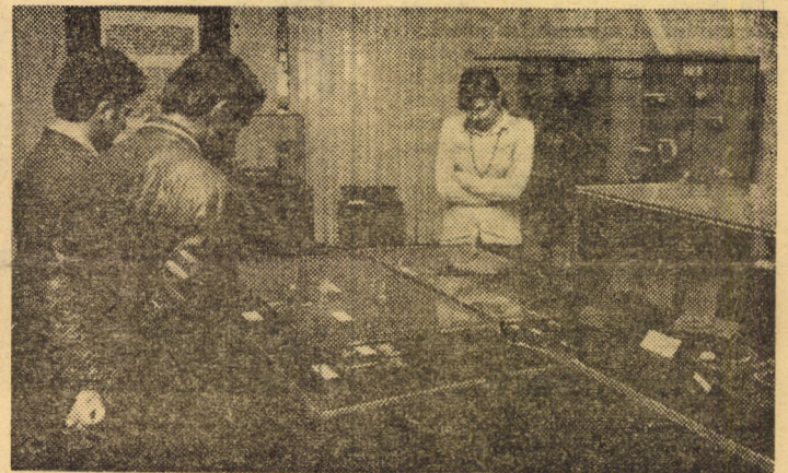
Aspect din expoziție