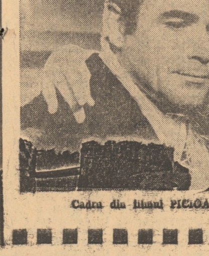
Cadrul din filmul PICIOARE LUNGI, DEGEȚE LUNGI

Singura formalitate înaintea aderării propriu-zise, prevăzută pentru 1 ianuarie 1973, o constituie ratificarea oficială, de către regina Margrethe a II-a, a tratatului de intrare în C.E.E., ratificare ce se va produce, după cum a informat primul ministru, la 11 octombrie.